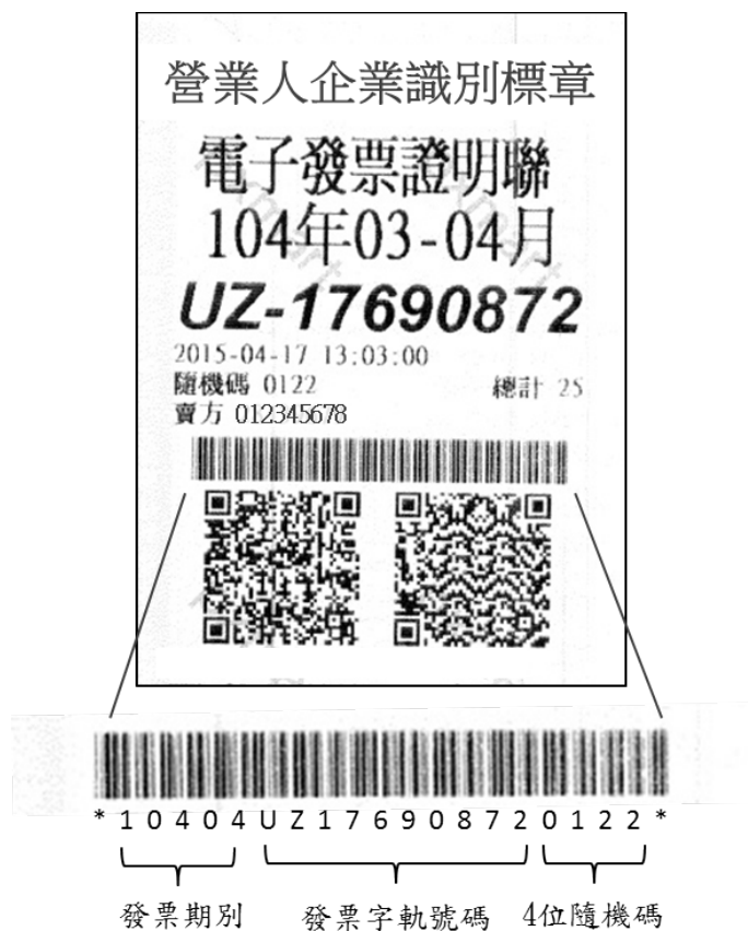
圖 1: 一維條碼範例