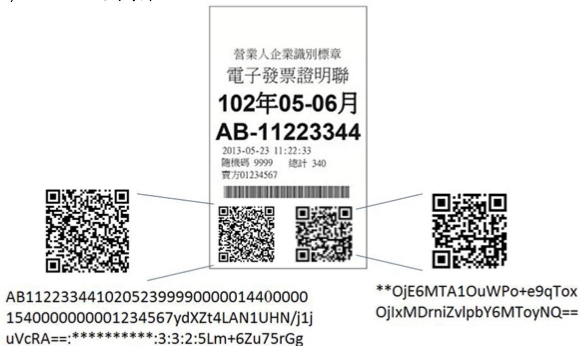
圖 4: 二維條碼範例(Base64 編碼)

本範例左方二維條碼資料為： AB112233441020523999900000144000001540000000001234567ydXZt4LAN1U HN/j1juVcRA==:*****:3:3:2:5Lm+6Zu75rGg