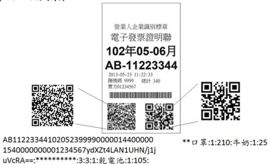
圖 3: 二維條碼範例(UTF-8 編碼)